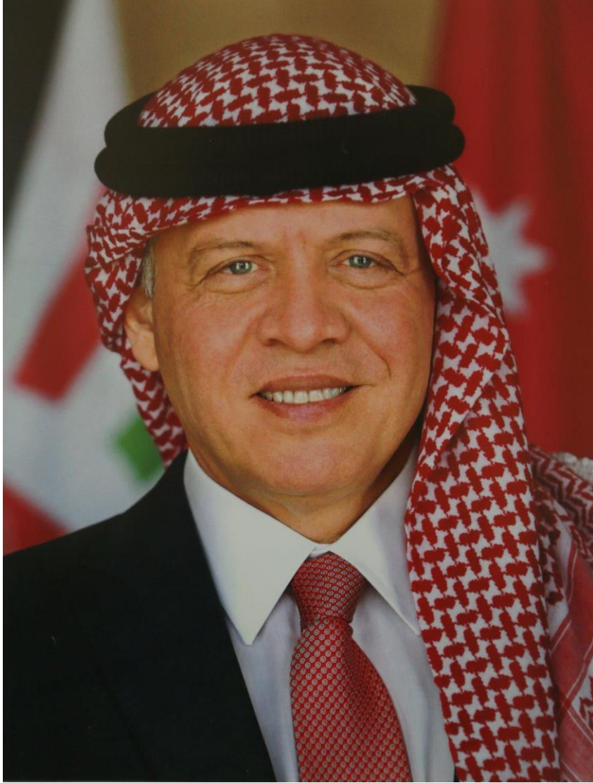
حضرة صاحب الجلالة الهاشمية الملك عبدالله الثاني بن الحسين "حفظه الله تعالى"