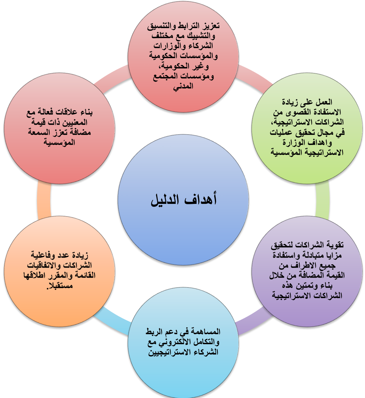
الشكل رقم (2)

أهداف الدليل: يهتف دليل تصنيف اصحاب العلاقة والشركاء وفقاً للشكل رقم (2) لتحقيق ما يلي: