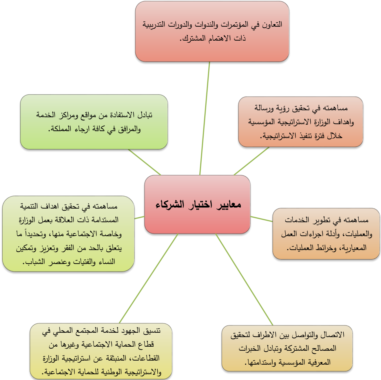
الشكل رقم (3)

هنالك العديد من المعايير ومؤشرات قياس الأداء الرئيسية التي تحكم عملية اختيار شركاء وزارة التنمية الاجتماعية الاستراتيجيين، ومن هذه المعايير التي يوضحها الشكل رقم (3) على سبيل المثال ما يلي: