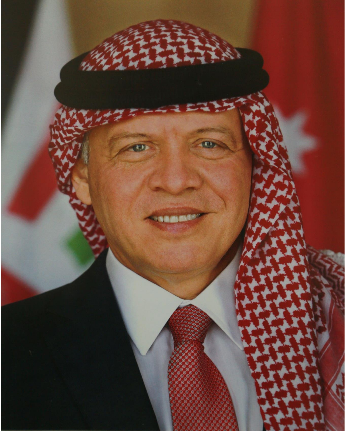
حضرة صاحب الجلالة الهاشمية الملك عبدالله الثاني ابن الحسين حفظه الله ورعاه