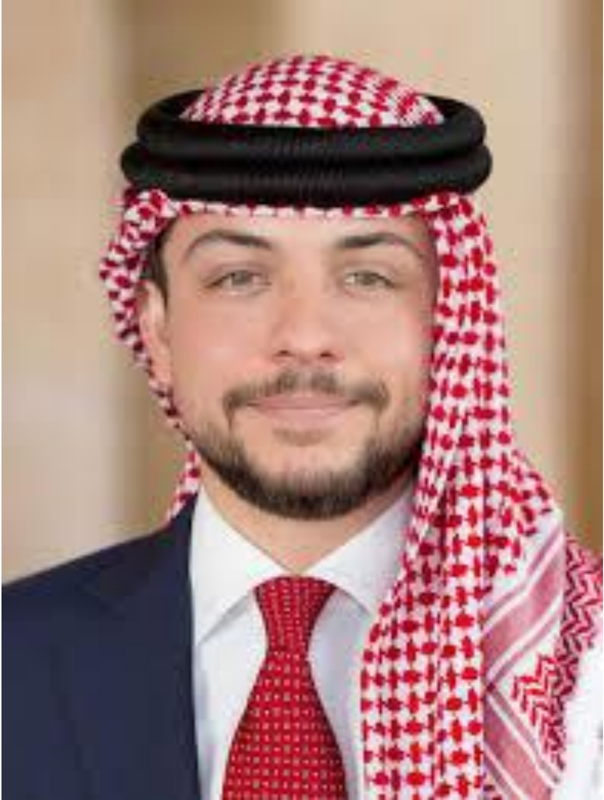
صاحب السمو الملكي الأمير الحسين بن عبد الله الثاني ولي العهد حفظه الله ورعاه